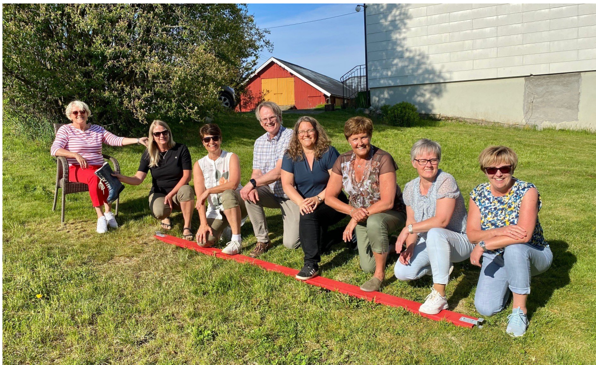
Leiarsamling 31. mai 2021

Statsforvaltaren i Møre og Romsdal er lokalisert på Fylkeshuset i Molde. Vi er tilsaman 151 tilsette, og i 2021 utgjorde dette 131,6 årsverk.