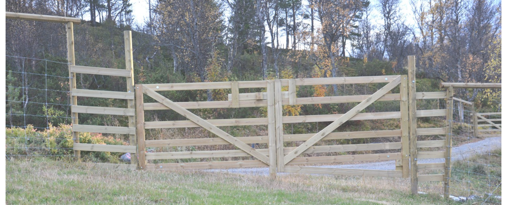
Et eksempel på dobbel grind. Merk forsterkningene på begge sider av grinda.