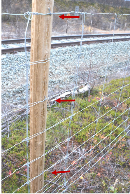
Gjerdet festes med 3 spikre (røde piler) - spikerdimensjon 2,8x75 mm. Skjøten har minst ei nettingrute overlegg.

Spiker er anbefalt framfor kramper. Ved store snømengder, eller når elg presser på gjerdet, vil spikeren bøyes ut uten at netting eller stolper ryker