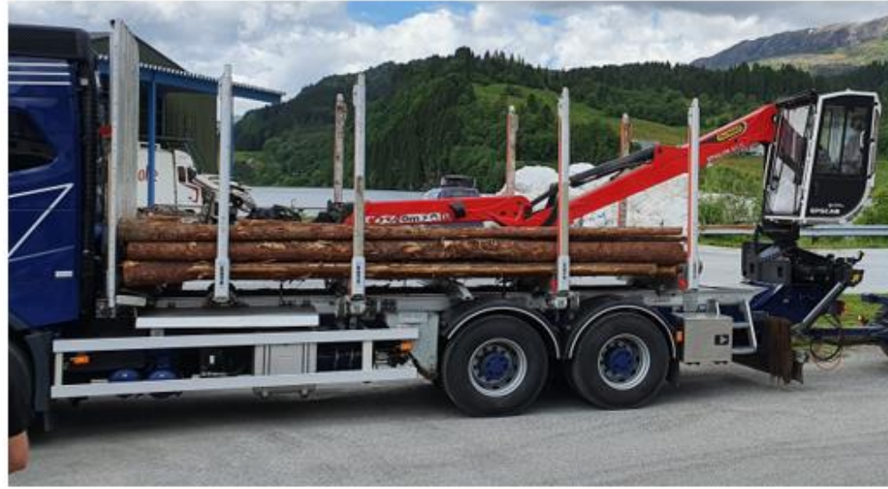
BK 8/32 – 19,5